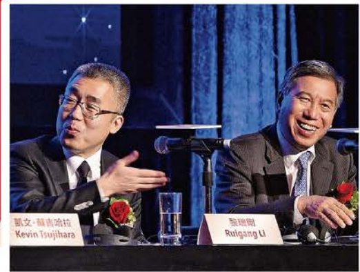
歐文·藤吉哈拉 Kevin Tsujihara