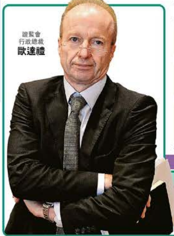
證監會 行政總裁 歐達禮